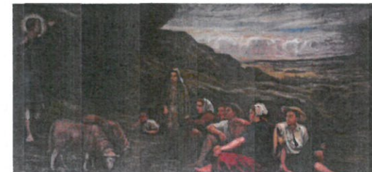
Le jeune Jean-Marie Vianney prêchant devant ses camarades