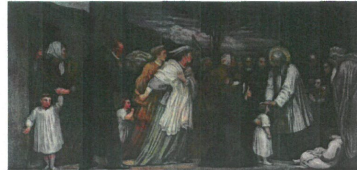
Jean-Marie Vianney accueillant paroissiens et pèlerins

Prêtre se consumant d'amour devant le Saint-Sacrement, tout donné à Dieu, à ses paroissiens et aux pèlerins, il meurt le 4 août 1859, après s'être livré jusqu'au bout de l'Amour. Sa pauvreté n'était pas feinte. Il savait qu'il mourrait un jour comme « prisonnier du confessionnal ».