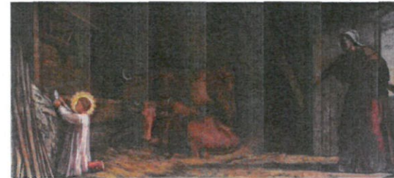
Jean-Marie Vianney enfant, priant devant une statue de Marie dans la grange familiale

Né le 8 mai 1786 à Dardilly, près de Lyon, dans une famille de cultivateurs, Jean-Marie Vianney connaît une enfance marquée par la ferveur et l'amour de ses parents. Le contexte de la Révolution française va cependant fortement influencer sa jeunesse : il fera sa première confession au pied de la grande horloge, dans la salle commune de la maison natale, et non pas dans l'église du village, et il recevra l'absolution d'un prêtre clandestin.